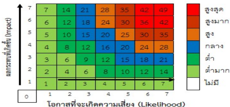
แผนภูมิความเสี่ยง (Risk Profile)